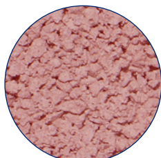
494 engels rood